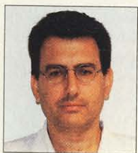
Γράφει ο ΓΕΩΡΓΙΟΣ Η. ΣΑΡΡΗΣ

Παρά τις επιτυχίες στη μεταμόσχευση νεφρών, η μεταμόσχευση καρδιάς εξακολουθούσε να φαντάζει όνειρο. Το όνειρο όμως έγινε πραγματικότητα χάρη στην επίμονη και συστηματική επιστημονική προσπάθεια του καθηγητή Norman Shumway στο Πανεπιστήμιο Stanford των ΗΠΑ. Με καθαρή επιστημονική σκέψη ο Shumway ε-